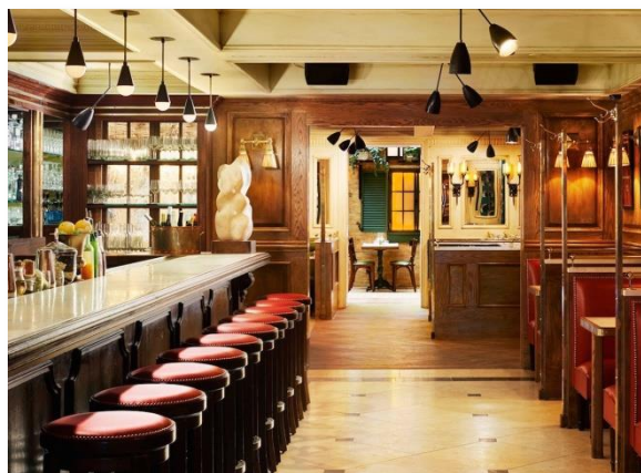
Сфера общественного питания